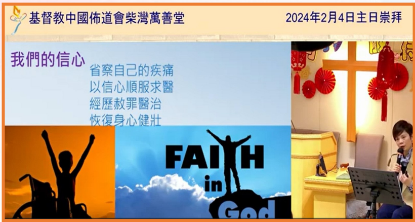
2月4日(主日) · 本機構同工吳祝玲傳道獲基督教中國佈道會柴灣萬善堂邀請在崇拜中宣講信息。